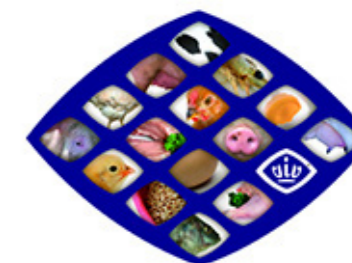
Организаторы – выставочная компания «Асти Групп» (Россия) и VNU Exhibitions Europe (Нидерланды) – познакомили руководителей компаний – лидеров отрасли, специалистов агропромышленного комплекса, представителей профильных департаментов и ассоциаций, а также представителей СМИ с новым форматом проведения мероприятия.

Когда мы спрашивали своих гостей, откуда они узнали о выставке VIV Europe, нам отвечали, что получили приглашение через вас. Адресные рассылки и публикации в журналах Издательского дома «Сфера» обеспечили своевременное оповещение о мероприятии компаний, расположенных на территории бывших российских республик, и в очередной раз подтвердили эффективность нашего партнерства! ▣