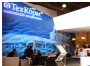
Выставка VIV Russia 2015 – это не только современные технологические разработки, но и производство качественной животноводческой и птицеводческой продукции в количестве, достаточном для удовлетворения нужд и потребностей российского продовольственного рынка.